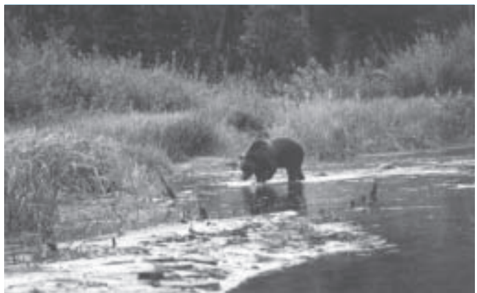
El turisme de natura cada vegada atrau a més persones.

El turisme de natura, en el seu sentit ampli, busca un espai d'oci en contacte amb el patrimoni natural, el qual es converteix en el centre de l'atracció turística. És aquella modalitat de turisme que es caracteritza per practicar-se en el medi natural. La pràctica dels anomenats esports d'aventura conjuga la vivència d'algun esport en plena natura que estimuli una situació arriscada. L'alpinisme, l'escalada, el descens de barrancs, el piragüisme d'aigües braves, el descens de rius o "rafting", o l'ala de pendent en són alguns exemples. A Catalunya hi ha una gran oferta d'aquest tipus de turisme. Les comarques pirinenques, per les seves característiques naturals, han vist amb aquestes activitats una oportunitat per reactivar les seves