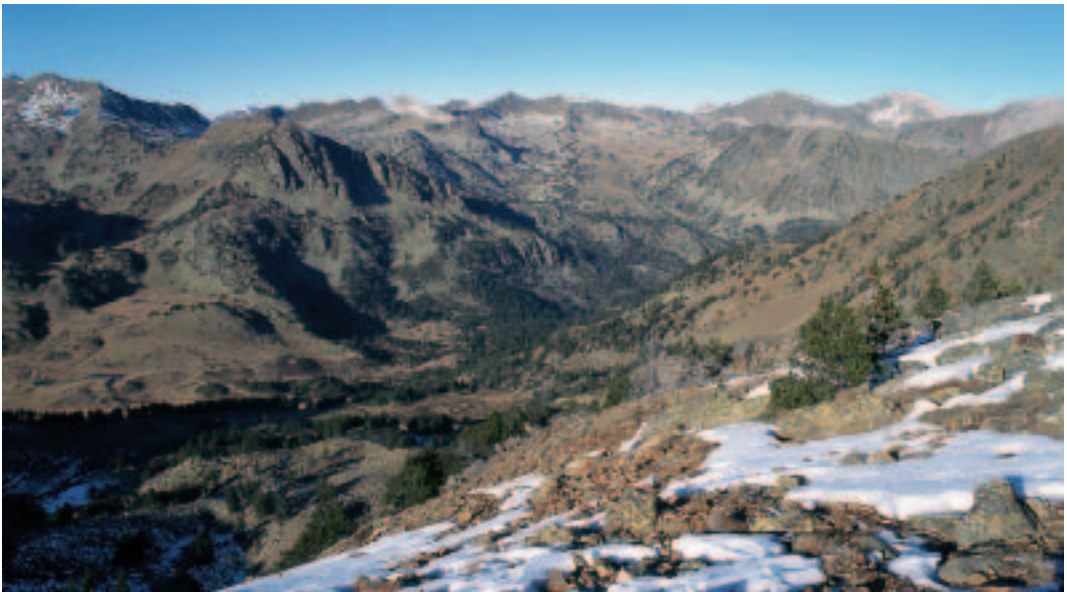
Les muntanyes són importants perquè inspiren valors culturals, hi habita un 10 % de la població mundial, són reservoris d'aigua i acullen una gran part de la biodiversitat mundial. (Vall d'Àreu).

Les destinacions de l'ecoturisme, anomenats també els ecodestins, es caracteritzen per ser zones de gran valor naturalístic. L'ecoturista cerca sobretot una sensació de proximitat amb la natura i la comunitat local, cerca sentir-se integrat amb la natura.