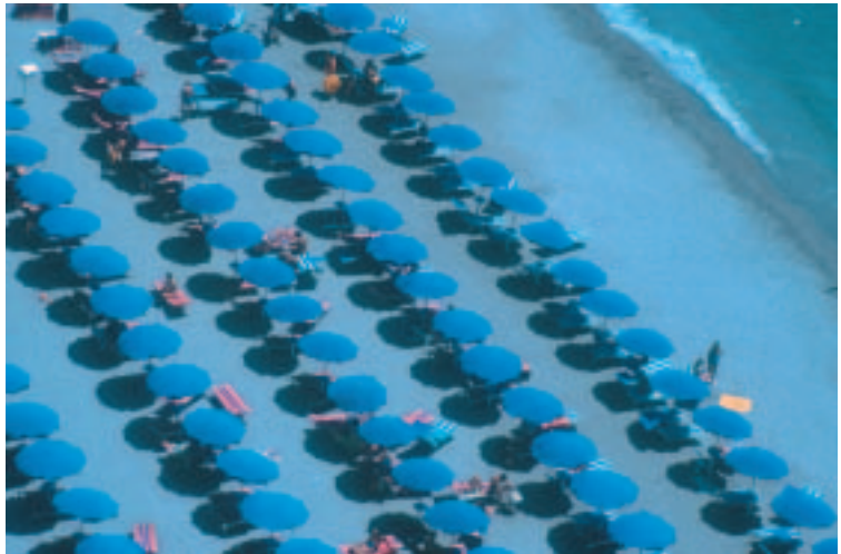
Platja plena de turistes. La imatge s'explica per ella sola i és un bon indicador del poder del turisme.

L'Organització Mundial del Turisme (OMT), una institució intergovernamental amb seu a Madrid, preveu que l'any 2002, 673 milions de persones viatgin per finalitats turístiques a un país estranger. Des de 1950, el nombre d'arribades de turistes internacionals ha augmentat gairebé 28 vega-