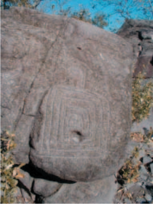
La descoberta de les cultura ancestrals és un element clau de l'estratègia ecoturística. Petroglif a la barranca del Cobre (Mèxic).

És per això que qualsevol destinació que vulgui atraure aquest tipus de turistes ha de protegir i preservar els seus recursos naturals. No és imprescindible que sigui un espai protegit legalment, però cada vegada hi ha més interès per l'explotació ecoturística dels espais protegits. Per tal d'assegurar que els plans de desenvolupament de l'ecoturisme en una determinada zona tinguin èxit, cal, sobretot, que aquests es facin en coordinació amb agents locals, particularment aquells que representen les comunitats locals.