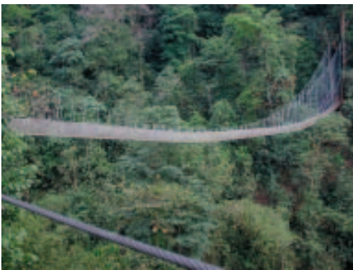
Les muntanyes estan destinades a seguir al centre del nostre interès perquè són una gran font d'inspiració per al nostre equilibri emocional.

Arreu del món s'han creat agències de viatges de natura. Per exemple, a Mongòlia on a més l'idioma i la infraestructura del país no facilita recórrer-la per un mateix, la major part de l'oferta turística té com a eix principal la natura. Operadors turístics especialitzats en viatges a les illes Galápagos, Costa Rica, Kenya i Nepal foren els pioners en