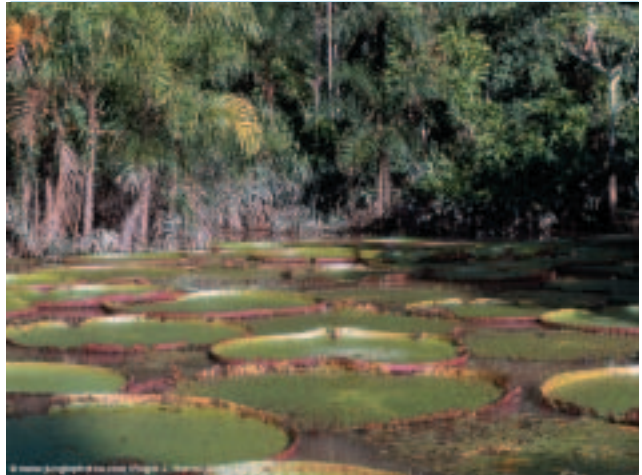
No n'hi ha prou d'enamorar-se de la natura durant unes vacances. L'ecoturisme contribueix a crear una sensibilització permanent.

Pel que fa al paper de la població local, els autèntics ecodestins han de disposar d'allotjaments, establiments de menjar i petits negocis regentats per la població local, afavorint així la relació entre la població local i els visitants. De fet, les infraestructures turístiques de l'ecoturisme han d'aconseguir que es creï un autèntic clima d'hospitalitat, lluny de la fredor i impersonalitat que presenten les infraestructures del turisme convencional. Generalment, un projecte d'ecoturisme té com a base un ecolodge o centre