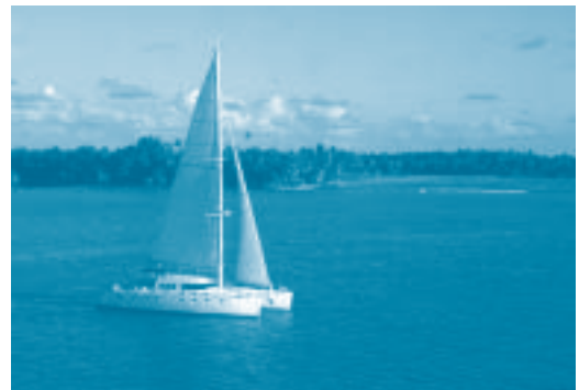
El mar rep l'impacte de milions de vaixells que malmeten els espais submarins litorals.

El turisme de sol i platja és aquell que depèn totalment de la disponibilitat d'un clima marcat per la radiació solar. Els turistes que el practiquen, lluny d'interessar-se pel patrimoni natural, històric o cultural de les zones que visiten, es limiten a gaudir dels beneficis de l'astre rei. La poderosa economia dels països de l'Europa centreeuropea, escassos de sol, va impulsar aquest tipus de turisme cap als països de la Mediterrània primer i després cap al tròpic. De fet, el turisme que té lloc al litoral català es basa en les cinc esses: sun, sex, sea, sand i sangria. Aquest tipus de turisme comporta un greu perill per a la conservació de la qualitat ambiental del nostre litoral. L'augment de la població a l'estiu a les poblacions costaneres comporta la sobreexplotació dels aquífers d'aigua potable, la dependència de consum d'energies no renovables i la construcció de grans infraestructures per acomodar el sector turístic. A més, es produeix una excessiva concentració de residus (sobretot a l'estiu) i un increment de la generació d'aigües residuals que comporta la sobrecàrre-