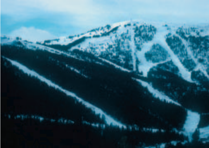
Les pistes d'esquí deixen una important petjada a les nostres muntanyes en forma d'erosió i pèrdua de biodiversitat, tal com ho avalen nombrosos estudis científics.

adverses per a les cultures locals. Pot accelerar la influència dels valors i dels productes materials occidentals a les zones indígenes i produir canvis en els àpats, la vestimenta i els rituals religiosos. A l'Himàlaia, per exemple, el creixent interès dels turistes pels festivals budistes ha fet que els monjos escurcin rituals per tal de no avorrir-los i ha aparegut un mercat negre d'art religiós.