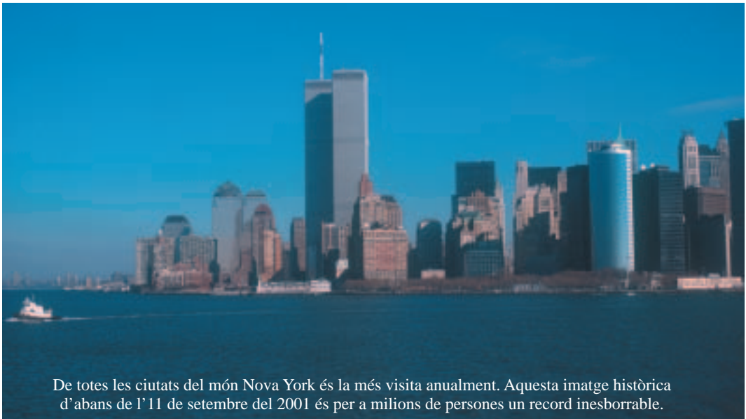
De totes les ciutats del món Nova York és la més visitada anualment. Aquesta imatge històrica d'abans de l'11 de setembre del 2001 és per a milions de persones un record inborrable.

El creixement i extensió geogràfica del turisme ha fet que aquesta indústria s'hagi convertit en una de les indústries més potents del món. La complexa naturalesa de les activitats turístiques fa que el volum de diners que mou el turisme sigui difícil de mesurar. Tanmateix, l'OMT estima que entre