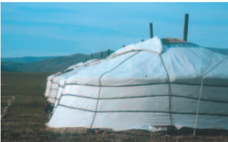
La incorporació del turisme en l'economia d'alguns països comporta el respecte a les tradicions locals.

del Carib i del Pacífic, el turisme reporta més del 40 % del PIB. L'any 1999, els ingressos del turisme internacional representaren dos terços de les exportacions de serveis i més del 10 % del total de les exportacions en aquests països, mentre que en els països desenvolupats, el turisme representava només un terç de les exportacions de serveis i el 7 % del total de les exportacions.