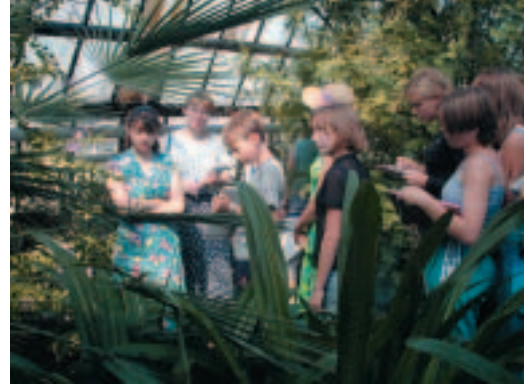
Aprendre de la natura per fer-nos més humils, ni que sigui per uns dies, és l'objectiu de l'ecoturisme.

passava de lluny els aconseguits per mitjà de la caça (activitat prohibida en el país l'any 1977). A la dècada dels vuitanta, les selves tropicals i els esculls coral·lins foren objecte d'un gran nombre d'estudis científics per evidenciar la seva valuosa diversitat biològica. Aquest interès impulsà el naixement