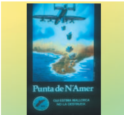
Cartell del Grup Ornitològic Balear dels anys 70 i que descriu la voluntat de molts dels illencs per conservar el seu patrimoni natural i cultural.

L'activitat turística té els seus orígens el segle XIX, amb la necessitat de descobrir nous indrets, ja fos per plaer o per estudi. De fet, la paraula turisme prové del terme anglès tour , paraula que fa referència a un fenomen que es considera precursor del turisme modern: l'anomenat Grand Tour. Aquesta activitat, de connotacions essencialment britàniques, consistia generalment en un recorregut de llarga durada dels joves aristòcrates de les illes per gran part del continent europeu, però especialment per França i Itàlia.