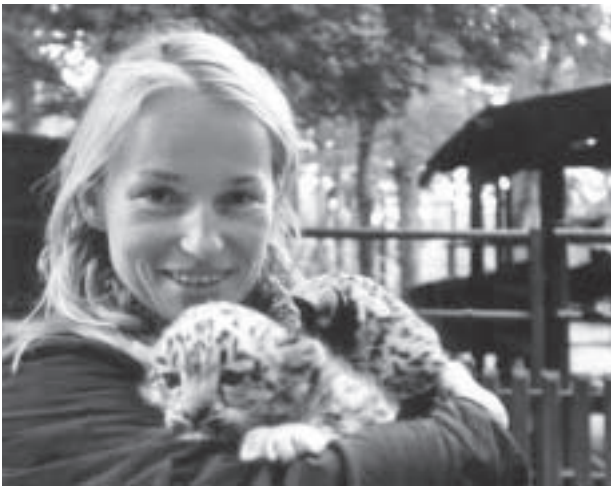
Participar en projectes de conservació d'espècies animals, com ara el lleopard de les neus a la reserva de la biosfera d'Issik-kul, pot ser una experiència inoblidable.

L'ecoturisme es considera una variant de l'anomenat turisme sostenible. El planejament, el desenvolupament i el funcionament de les