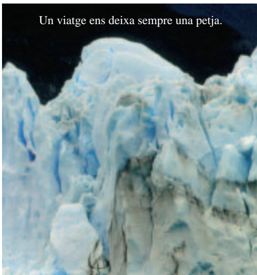
Un viatge ens deixa sempre una petja.

Finalment, us oferim una llista de diverses propostes turístiques del mercat. A partir dels títols podeu explorar les preferències que podrien tenir els alumnes i de les raons que els motivarien a escollir el seu viatge ideal.