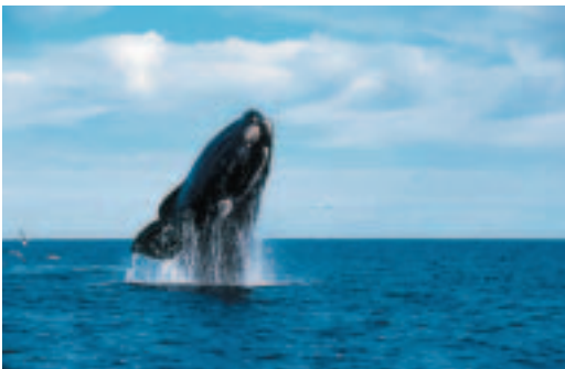
L'observació de balenes i, en general, de cetacis marins és un dels espectacles de la natura dels quals els viatgers queden més impressionats.

En tota experiència d'ecoturisme és fonamental la participació de la població local. Ningú millor que la gent que viu en les zones on es desenvolupa l'activitat ecoturística coneix l'entorn i sap mostrar els recursos naturals. Ells són els que saben on es poden observar els animals, on es troben les plantes interessants, etc. És la població nadiua qui sap com gestionar els ecosistemes locals i no malmetre'ls. Qualsevol projecte d'ecoturisme no té sentit sense la implicació de les comunitats locals.