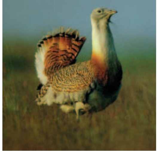
En alguns indrets la conservació d'una espècie emblemàtica pot esdevenir el motiu per endegar una estratègia ecoturística.

La població local pot beneficiar-se de l'activitat ecoturística per diferents vies. Per un costat, l'arribada de turistes a la zona proporciona una entrada de divises important. Es creen noves activitats econòmiques, que substitueixen o complementen les activitats tradicionals. Els pobladors locals poden dedicar-se a noves ocupacions com ara la fabricació i venda d'artesanía o el guiatge per observar animals i plantes, etc. Tot i que és possible que no tots els residents en treguin algun profit, aquestes iniciatives solen ser útils per repartir els beneficis del turisme en un àmbit més ampli.