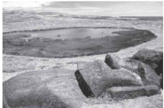
Un projecte català vol solucionar els problemes ambientals de l'illa de Pascua (Xile) que té una superfície de 162 km 2 , 3.500 habitants i rep uns 25.000 turistes l'any. La solució és l'ecoturisme.

Moltes de les empreses turístiques més grans del món, des d'hotels a operadors estan avançant cap a la incorporació de criteris ambientals en el seu funcionament. Algunes d'aquestes mesures són la reducció del consum d'aigua, d'energia i d'altres recursos, i la millora de la gestió, maneig i disposició dels residus. Aquests canvis produïts en la indústria hotelera tenen un gran impacte positiu, no sols per la gran quantitat