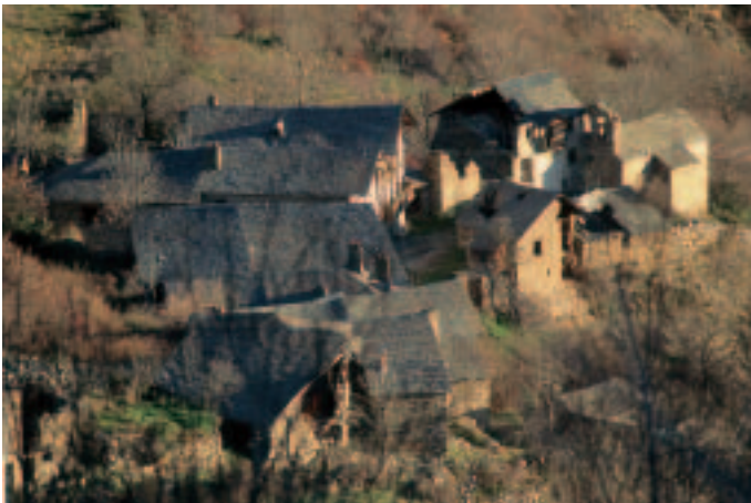
El poble abandonat d'Àrreu (Pirineus), el qual podria ser rahabilitat per convertir-se en un equipament ecoturístic i dinamitzar l'economia de la regió.

és en un 59 % una persona entre 20 i 39 anys, amb una presència més gran de dones (55 %) i un salari de 1.500 a 2.400 euros/mes. El respecte per la cultura i les tradicions locals és un dels aspectes més importants per a l'ecoturista (un 85 %). Al voltant d'un 29 % dels ecoturistes té com a activitat principal la visita d'un espai natural protegit, un 13 % el trekking i un 5 % la contemplació de la natura. Tanmateix, la major part dels tourope-radors i oficines de turisme