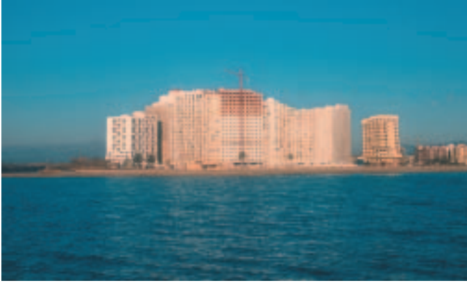
L'any 2001 els espanyols van fer 46,5 milions de viatges turístics. El principal destí fou el litoral mediterrani.

economies, afectades per l'abandonament del camp. A finals del 2000, al territori català hi havia 54 empreses que s'hi dedicaven, un 10 % més que l'any anterior, la majoria situades en les comarques de muntanya. La pràctica d'aquestes modalitats de turisme és clarament una altra forma de consum de la natura, sovint amb un notable impacte negatiu i força agressiva per al medi. Els esports d'aventura simplement utilitzen l'entorn natural per fer les seves activitats lúdiques, però en cap moment no es tenen en compte criteris de sostenibilitat o de preservació de l'entorn.