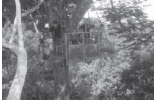
El binomi desenvolupament i conservació a les àrees naturals és sempre un equilibri difícil. Un mirador sobre la selva tropical.

Tot i aquesta diversitat d'allotjaments, un autèntic ecolodge hauria de construir-se amb el mínim impacte sobre el medi, usant materials i recursos autòctons i hauria de quedar plenament integrat i en harmonia amb l'entorn. Allò que caracteritza un autèntic ecolodge és que sigui construït amb la parti-