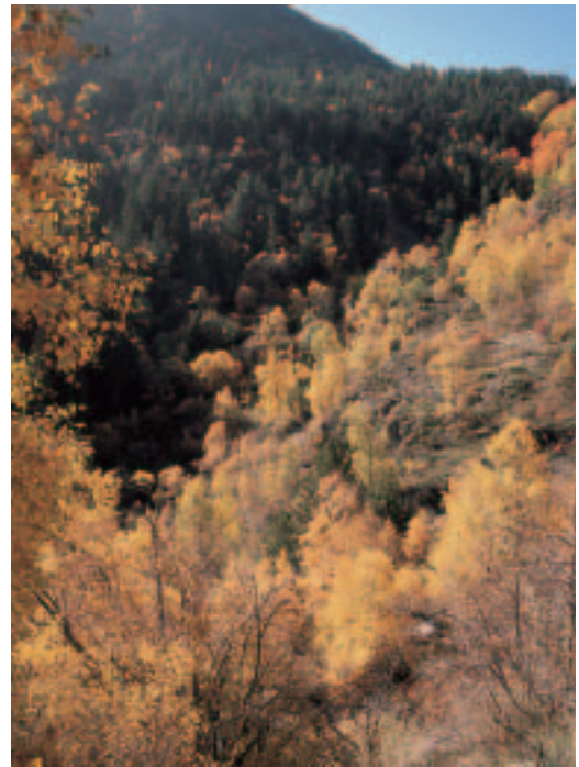
Massa vegades en nom del turisme es malmeten precisament les bel·leses naturals que poden mantenir un turisme sostenible, com li passarà a aquest bosc de la vall d'Àrreu, un dels millors refugis de la biodiversitat catalana.

A més a més, el turisme avui dia és un luxe que es pot permetre una part molt petita de la població mundial. De fet, els turistes internacionals representen només el 3,5 % de la població mundial. La gran quantitat de consum d'energia i d'altres recursos que porta associat el turisme fa que sigui impossible que es pugui generalitzar. L'ecoturisme és una proposta sensata per promoure el turisme sostenible, però no és pot amagar l'impacte ambiental dels desplaçaments en avió que comporta.