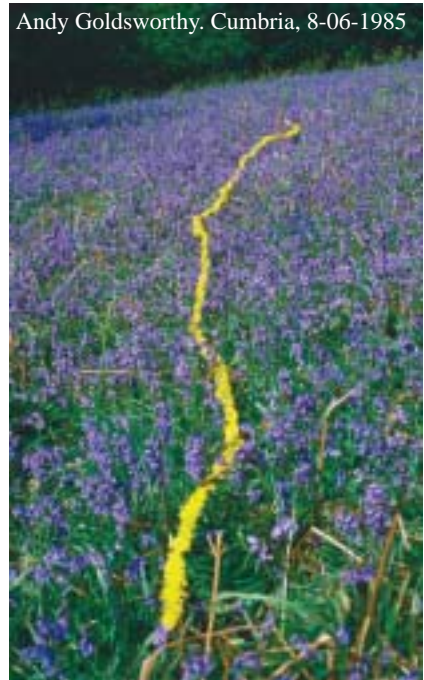
Andy Goldsworthy. Cumbria, 8-06-1985

No és possible canviar una actitud col·lectiva sense una bona motivació. La catàstrofe és ben segur un incentiu, però això no significa que hagi d'harmonitzar forces positives. Recordem el desastre causat pel Katrina (2006) a Nova Orleans. La desolació no es va emprar per solidaritzar-se amb els damnificats, sinó per aprofitar l'excusa per expulsar els pobres de la ciutat i emprendre una remodelació urbanística favorable als rics. L'única força per al canvi ètic és la de l'amor. I com diu la màxima, "per estimar cal conèixer" i no pas només per la via racional. En l'amor són fonamentals les emocions. La natura ens ofereix aquest espai per conèixer, estimar i emocionar-nos. Andy Goldsworthy (1956-) és un artista britànic que crea obres d'art només fent servir les seves mans i materials de la natura (branquetes, flors, pedres, fulles, etc.). En aquesta pàgina il·lustrem una d'aquestes formes efímeres (feta l'any 1985 en un