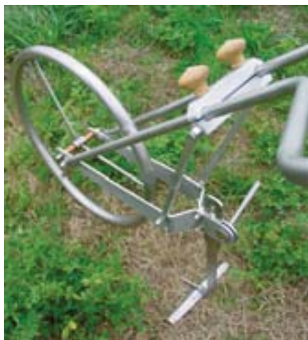
Bicicleta para arar

Herramientas para la horticultura familiar