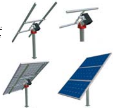
Mini Seguidor SF4

Los seguidores solares aumentan la eficiencia de paneles solares fotovoltaicos para la producción de electricidad, porque permiten la orientación constante de los paneles hacia el sol. Suponen un coste a añadir inicialmente, pero también se aumenta el rendimiento del sistema. Actualmente existen seguidores pequeños, para pequeñas potencias, adecuados para viviendas aisladas, señalizaciones, farolas autónomas, etc. Queremos señalar el diseño de una empresa catalana, FEINA, Sccl, que fabrica seguidores de 1 m 2 a 4 m 2 de paneles fotovoltaicos. El incremento de rendimiento del sistema fotovoltaico al incorporar el seguidor respecto a los paneles fijos sería de un 26 a un 30%.