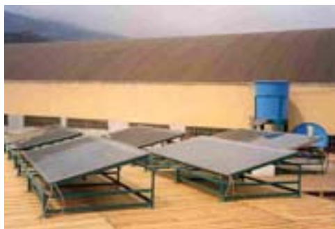
Purificación de agua con tecnología solar.

Otro sistema similar es el modelo de colector solar de uso directo a base de una manga de riego. Existe un modelo comercial de fácil montaje que aprovecha este efecto (la ducha solar Sunny ).