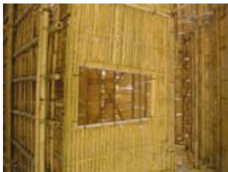
Casa hecha de bambú.

estudiado para crear estructuras muy resistentes. Las cañas se pueden cubrir totalmente o parcialmente con piedras, yeso, o rebozo de arcilla. La arquitectura cultivable es similar a la técnica de la “arboricultura”, que guía el crecimiento natural de arbustos y árboles para crear estructuras u objetos, y también se aplica a la creación de casas hechas con árboles vivos y que crecen.