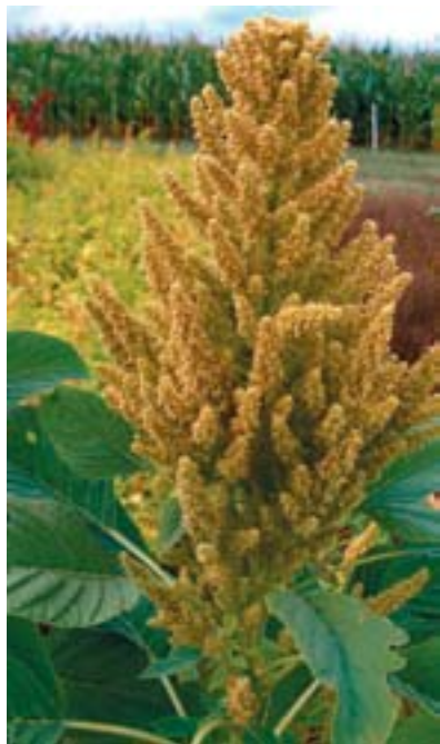
Planta de amaranto.

La quinoa ( Chenopodium quinoa ) es una planta originaria de los Andes que se caracteriza por la producción de un grano similar al del arroz, pero con un valor nutritivo más elevado, y que se prepara de la misma forma.