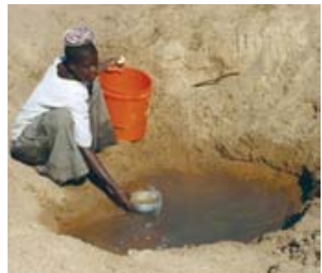
Sacando agua de un pozo en medio de la nada.

Según las Naciones Unidas, una persona necesita cada día unos cincuenta litros de agua (cinco para beber, diez para cocinar, quince para la higiene personal y veinte para usos de saneamiento). En cambio, la media de consumo de agua potable en los EUA es de 284 litros per cápita (y