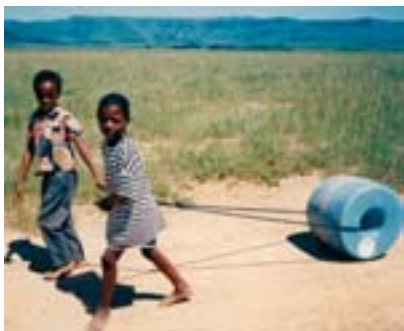
Hipporoller y Q-drum

AquaStar es un sistema portátil de purificación de agua con radiación UV-C. Es un dispositivo ligero (pesa unos cien gramos), resistente y pequeño, ya que se trata de una adaptación de las habituales botellas de agua de policarbonato utilizadas en la montaña. Puede tratar un litro de agua en un minuto y tiene una larga duración (unas 8000 horas de uso de la lámpara de UV-C). Para su funcionamiento, utiliza dos pilas estándar para cámaras. Incluye un control electrónico que programa la dosis correcta de radiación (longitud de onda de 254 nm) para hacer el agua segura. Se presenta como un producto para excursionistas, situaciones de emergencia y familias sin acceso a agua limpia.