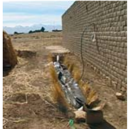
Biodigestor en construcción.

Hay proyectos para convertir la orina y los excrementos humanos (mezclados con residuos orgánicos como piel de plátano, algas y otros) en una fuente de biogás de bajo coste. Otro sistema es un water que permite convertir las heces en biogás y la orina en fertilizante.