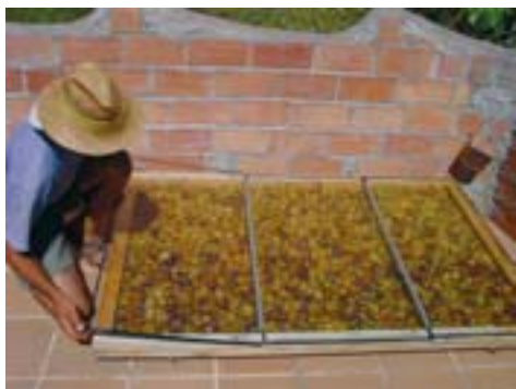
Secadero y pasteurizador solar