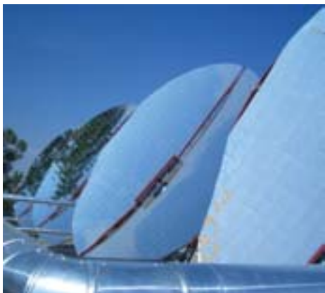
Reflectores solares comunitarios Scheffler

El horno solar aprovecha el efecto invernadero que se crea en una caja aislada, con el interior negro y una cubierta de cristal, cuando se expone al sol, para cocinar con una fuente renovable y limpia como es el sol. Permite hacer preparados al horno, pero también cazuelas. A diferencia de las cocinas solares de concentración, no requiere ser orientado tan a menudo y puede funcionar si hay nubes de manera momentánea, ya que acumula el calor, pero los tiempos de cocción son superiores. Los alimentos nunca se quemarían y no provoca deslumbramientos. Es un sistema de fácil construcción, pero también existen hornos solares comerciales de gran calidad.