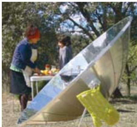
Cocina solar parabólica

de contribuir al cambio climático, el uso masivo de la leña provoca deforestación y genera contaminación local y problemas de salud: se consumen 1.500 millones de m 2 de madera cada año sólo para ser quemada en fuegos en el suelo para cocinar o calentarse, y su humo genera problemas respiratorios y oculares, sobre todo a las mujeres y niños, los más expuestos. Por otro lado, cerca de 2.000 millones de personas en el mundo no disponen de electricidad, cosa que les impide usar determinadas tecnologías o sistemas de comunicación. Las alternativas son tecnologías sencillas y sostenibles, como los sistemas de cocción y procesamiento solar de alimentos, el aprovechamiento eólico o hídrico a pequeña escala o los aparatos eléctricos autorecargables.