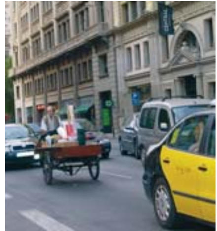
Un triciclo de transporte por el centro de Barcelona haciendo una mudanza.

milares para cargar embalajes, datan de finales del siglo XIX. Desde los triciclos hasta las bicicletas con bandeja delantera, los artilugios con pedales para el transporte han sido de lo más variado. Son bien conocidos los rickshaw o taxis bici, muy comunes en países asiáticos, pasando por los triciclos para barrenderos o equipados con cajas para poder cargar petates o paquetes muy grandes. Las posibilidades de la bicicleta, ni que sea para aliviar el arrastre (sin pedalear) de mercancías, quedan demostradas en muchas experiencias. La bicicleta de transporte constituye una herramienta cuyo diseño permite múltiples funciones, más allá de trasladar personas y evitar la contaminación del aire de las ciudades y reducir el ruido. Fomentar la tecnología aplicable en convertir la bicicleta en un vehículo de transporte es una opción sostenible ineludible.