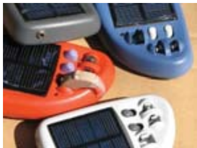
Audífonos solares SolarAid desarrollados por Godisa.

dólares) hechas de caucho, madera y tiras de cuero, que pueden tener una duración de cinco años. Esta prótesis, conocida como pie de Jaipur, fue creada a finales de los años sesenta, pero todavía no se ha reconocido el ingenio de Chandra que permitió este invento.