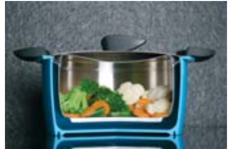
Corte de una olla de calor retenido.

Otro es la eficiente olla Hotpan, que fabrica Kuhn Rokon, la cual incorpora en su diseño el aislamiento para poder acabar la cocción con calor retenido. Las ollas aisladas reducen el consumo energético, porque retienen el calor y permiten acabar la cocción de los alimentos una vez parada la aportación de energía. Utensilios como el Hotpan, que permiten aplicar calor brevemente a la olla de cocción y acto seguido aprovechar el aislamiento del conjunto, permiten acabar la cocción de los alimentos ahorrando hasta el 60% de la energía en comparación con una olla convencional. Resulta especialmente interesante para alimentos de larga cocción como legumbres, pero se puede utilizar con todo tipo de alimentos (arroz, verduras, etc.).