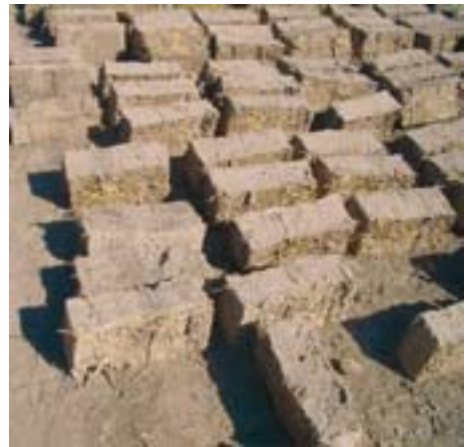
Fabricación de abobes.

Se pueden construir casas con paredes, rebozos, pavimentos y techos de tierra cruda (sin cocer) con diferentes técnicas según las costumbres locales, el clima y la tierra disponible: el tapial (muros de tierra prensada), la adobe (bloques de fango secados al sol), el cob (muros de una mezcla de fango y paja), los bloques de tierra compactada (hechos con moldes o máquinas sencillas) o las bolsas de tierra (bolsas de polipropileno repletas de tierra con las que se pueden hacer construcciones tanto provisionales como definitivas).