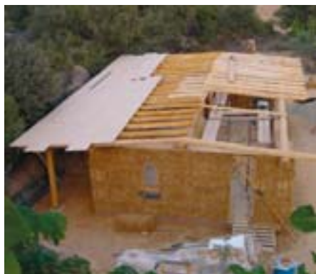
Casas de paja (Strawbale)

Se necesita un nuevo equilibrio. Se ha de garantizar el acceso a una vivienda digna, que no dañe la salud de sus ocupantes ni del entorno. Las tecnologías apropiadas de construcción utilizan materiales naturales, renovables, disponibles en el mismo lugar donde se han de usar y permiten construir refugios de bajo coste y resistentes, ya que aprovechan los recursos naturales disponibles para su funcionamiento.